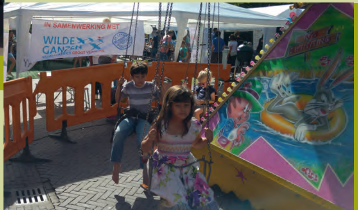
De zweefmolen maakte overuren.