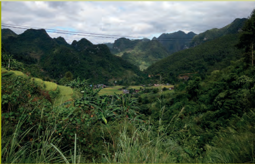
Wij komen juist op de meest afgelegen gebieden.

Onze Kernboodschap is dat CSVN het kosteneffectief mogelijk maakt dat kansarme kinderen in verafgelegen gebieden in Vietnam een toekomst wordt geboden.