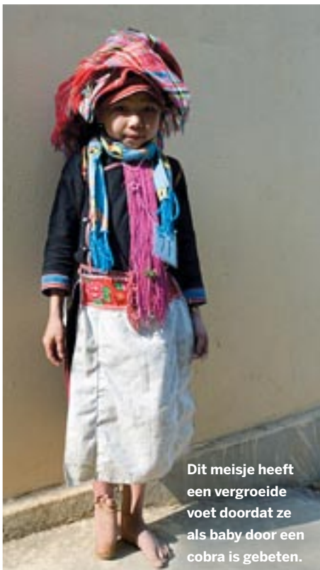
Dit meisje heeft een vergroeide voet doordat ze als baby door een cobra is gebeten.