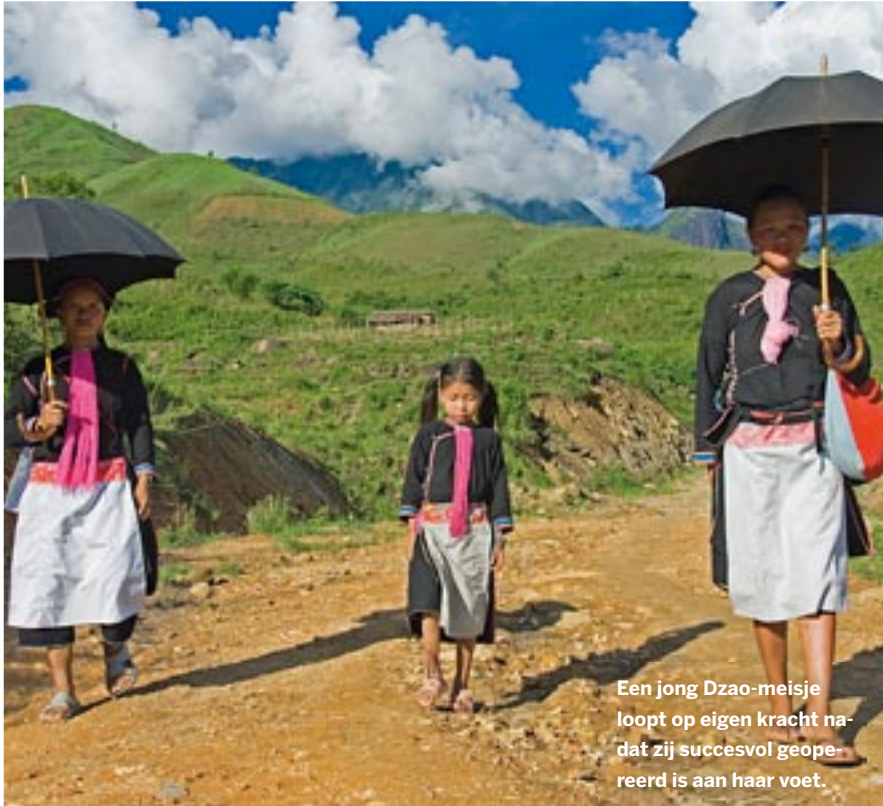
Een jong Dzao-meisje loopt op eigen kracht nadat zij succesvol geoperieerd is aan haar voet.