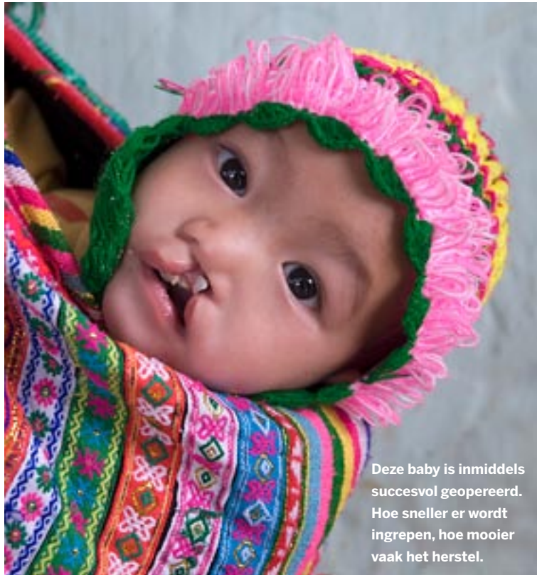
Deze baby is inmiddels succesvol geopereerd. Hoe sneller er wordt ingrepen, hoe mooier vaak het herstel.