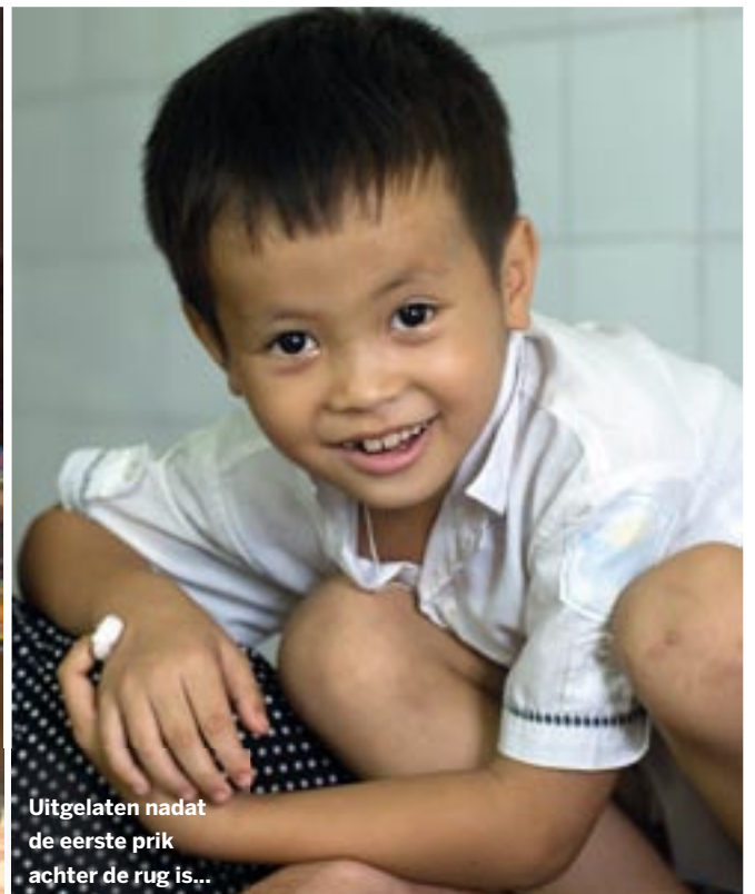
Uitgelaten nadat de eerste prik achter de rug is...