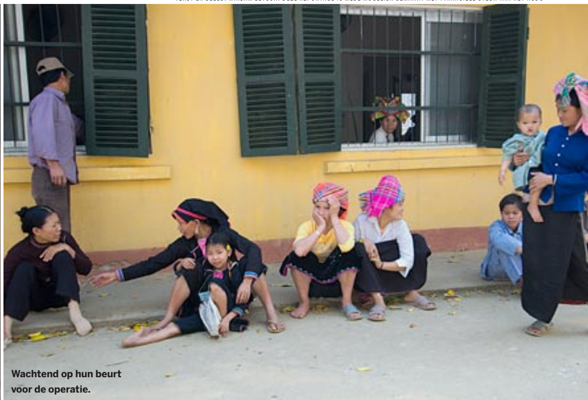
Wachtend op hun beurt voor de operatie.