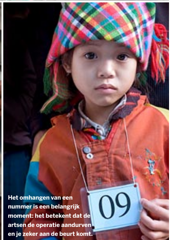
Het omhangen van een nummer is een belangrijk moment: het betekent dat de artsen de operatie aandurven en je zeker aan de beurt komt.